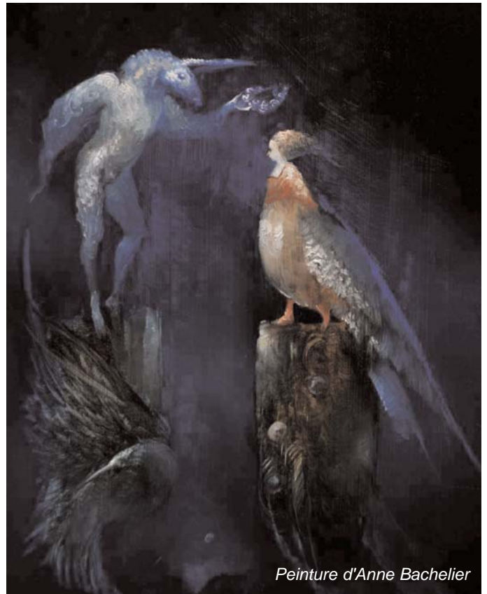
Peinture d'Anne Bachelier

À nouveau, c'est un bel exemple de ces énergies parfaitement naturelles qui, lorsque nous essayons de les repousser, de les tasser, deviennent démoniaques et nous attaquent. Elles posent problème car plus nous luttons contre elles, plus elles gagnent en puissance. C'est le même thème que le dragon dans les contes de fées : lorsqu'on lui coupe une tête, trois autres poussent. Cela commence avec des chiots, mais lorsque vous essayez de les enfermer dans le coffre de la voiture, rapidement, ils se transforment exactement comme