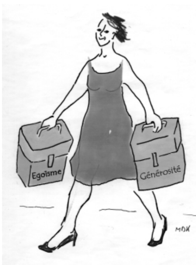
Une partie reniée existe toujours cachée sous la primaire