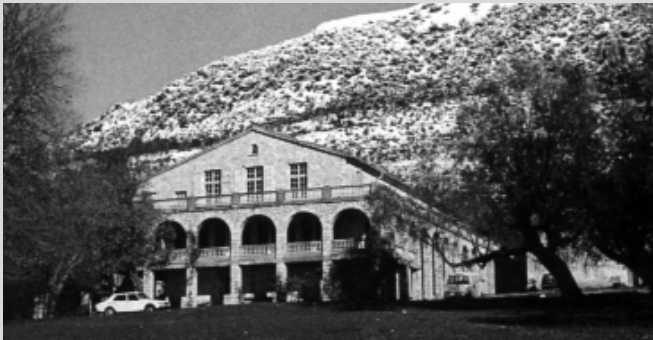
Tous les stages ont lieu aux Courmettes, réserve naturelle au cœur de l'arrière pays Niçois.

18 & 19 déc. 99 : L'enfant intérieur 19 & 20 fév. : Les voix critiques 15 & 16 avril : Les archétypes 17 & 18 juin : Les énergies instinctives Renseignements : écrire au siège de l'association.