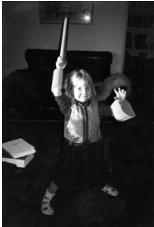
Toutes les énergies sont présentes chez l'enfant

4. La dimension énergétique , c'est le dernier développement de notre travail. Toute relation n'est pas faite uniquement d'une réalité psychologique, émotionnelle, physique ou spirituelle. Une relation, c'est également une réalité énergétique. La capacité d'apprendre à jouer avec son propre système énergétique comme d'un très bel instrument et de développer une réelle maîtrise des interactions énergétiques est maintenant une nécessité pour quiconque veut entrer dans ce travail.